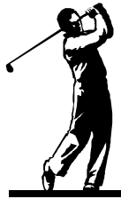
(ゴルフをしました)