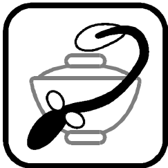
(うなぎを た 食べました)