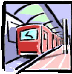
(ちかてつに のりました！)