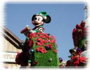
(ディズニーランドへ…)