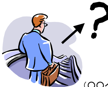
(〇〇へ い 行きました)