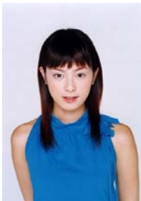
(〇〇 せんせい 先生の かのじょ 彼女に…)