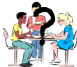
(〇〇を た 食べました)