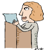
やまだせんせい 山田先生